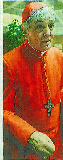
La carriera Edoardo Menichelli, 79 anni, creato cardinale nel 2015 da papa Francesco, è arcivescovo emerito di Ancona-Osimo dal 2017

di discussione serena, senza scontri all'arma bianca, ma rispettosa del mistero che ci portiamo addosso. Dobbiamo abbandonare le posizioni di parte e riconoscere il mistero della nostra vita e della nostra morte. Sappiamo ben poco. La vita la riceviamo per dono, non sappia-